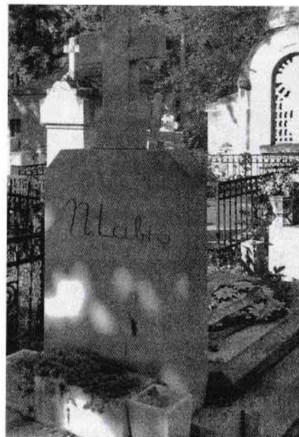
Mormântul poetului la Cimitirul Bellu din București